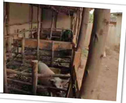
De boerderij van de weduwen van Giterama, Rwanda