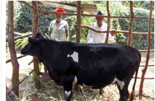
LB - zoeken naar de koe met het goede nummer; LO - koe gevonden! RB - dader met dochtertje van slachtoffer en koe naar huis; het ultieme vertrouwen! RO - koe veilig thuis in de stal.