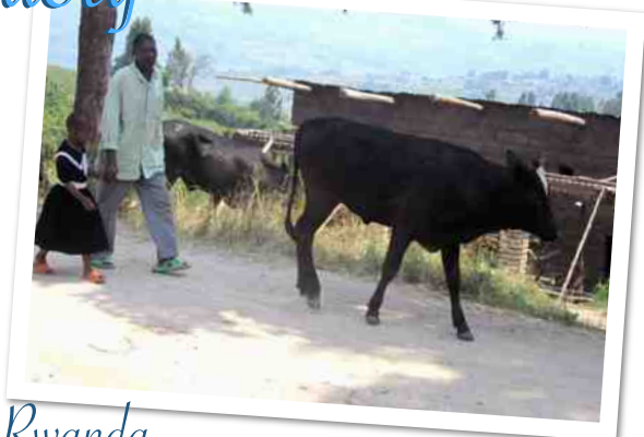
Cows for Peace, Rwanda