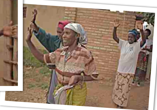
LB - Veel nieuwe gebouwen zijn gerealiseerd; M - De hokken voor de konijnen; RB - Stallen voor de dieren; LO - Even drinken met baby voor huisje op de matten; M - Dansende vrouwen; RO Uitzwaaien!